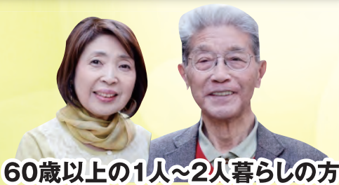
60歳以上の1人~2人暮らしの方